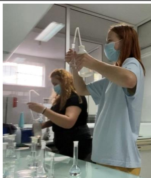
Slika: Erasmus+ praksa na Portugalskem

Gimnazija in srednja šola za kemijo in farmacijo ima sodobno opremljene laboratorije, kar dijakom omogoča usvajanje znanja za poklic kemika. V okviru mednarodnega projekta Erasmus+ je dijakom omogočeno opravljanje prakse v tujini. Šola sodeluje s podjetji kemijske stroke, saj dijaki pri njih opravljajo redno šolsko prakso. V zadnjih letih so za bodoče kemike razpisane kadrovske štipendije.